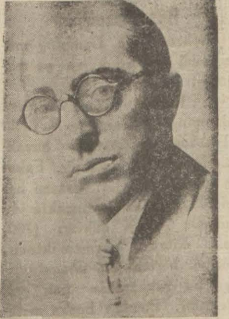
Hariciye Vekili T. Rüşü B. gösterecektir ki Büyük Gazinin [Devamı 6 ıncı sayfamızda]